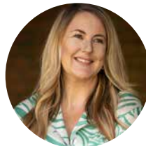
Sophie Howe Comisiynydd Cenedlaethau'r Dyfodol Cymru

Rhaid inni sicrhau bod dyfodol posibl yn cael ei ystyried wrth i ni weithio i fynd i'r afael ag anghydraddoldeb yng Nghymru ac mae Deddf Llesiant Cenedlaethau'r Dyfodol yn rhoi cwmpawd inni deithio trwy a thu hwnt i'r pandemig presennol i greu Cymru iachach a mwy cynaliadwy na Chymru heddiw. Rhaid inni achub ar gyfleoedd i gyflymu ffyrdd newydd o weithio a allai fynd â ni tuag at Gymru fwy cyfartal, osgoi gwneud penderfyniadau a allai waethygu anghydraddoldeb yn anfwriadol a bod yn barod i weithredu nawr i liniaru tueddiadau'r dyfodol a allai wneud pethau'n waeth. Gobeithiwn y bydd yr adroddiad hwn yn rhan bwysig o'r ddadl ar sut rydym yn gwneud hyn gyda'n gilydd.