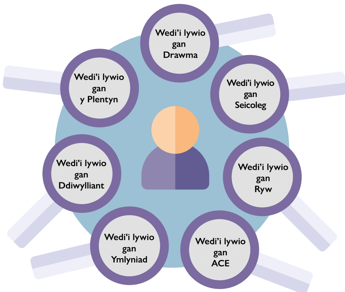
Ffigur 2: "Lensys" cydberthynas

Lle bo modd, darparwyd diffiniad i helpu i wahaniaethu rhwng y gwahanol ffyrdd hyn o weithio yn y rhestr termau (tt 2).