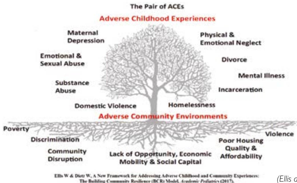
Ffigur 1: The Pair of ACEs Tree

Mae'r model BCR yn darparu diagram, The Pair of ACEs Tree (Ffigur 1) i ddangos y berthynas rhwng adfyd o fewn teulu ac adfyd o fewn cymuned. Mae'r dail ar y goeden yn cynrychioli 'symptomau' ACEs sy'n hawdd eu hadnabod mewn lleoliadau clinigol, addysgol a gwasanaethau cymdeithasol. Mae'r goeden wedi'i phlannu mewn pridd gwael sydd wedi'i drwytho mewn anghydraddoldebau megis diffyg tai fforddiadwy a diogel, trais cymunedol, gwahaniaethu systemig, a mynediad cyfyngedig i symudedd cymdeithasol ac economaidd. Mae'r rhain yn gwaethygu ei gilydd, gan greu cylch negyddol o bridd sy'n gwaethygu'n barhaus sy'n arwain at ddail yn gwywo ar y goeden. Crëwyd yr adnodd The Pair of ACEs Tree i gyfleu bod polisiâu i fynd i'r afael ag adfyd sydd wedi'u gwreiddio mewn cymunedau, wedi'u gwreiddio mewn systemau (Ellis a Dietz, 2017).