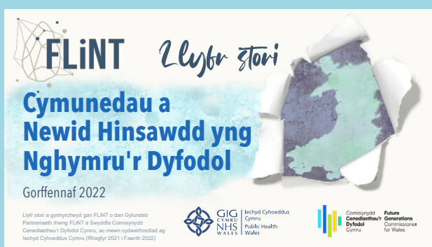
Cymunedau a Newid yn yr Hinsawdd yng Nghymru'r Dyfodol: Llyfr stori